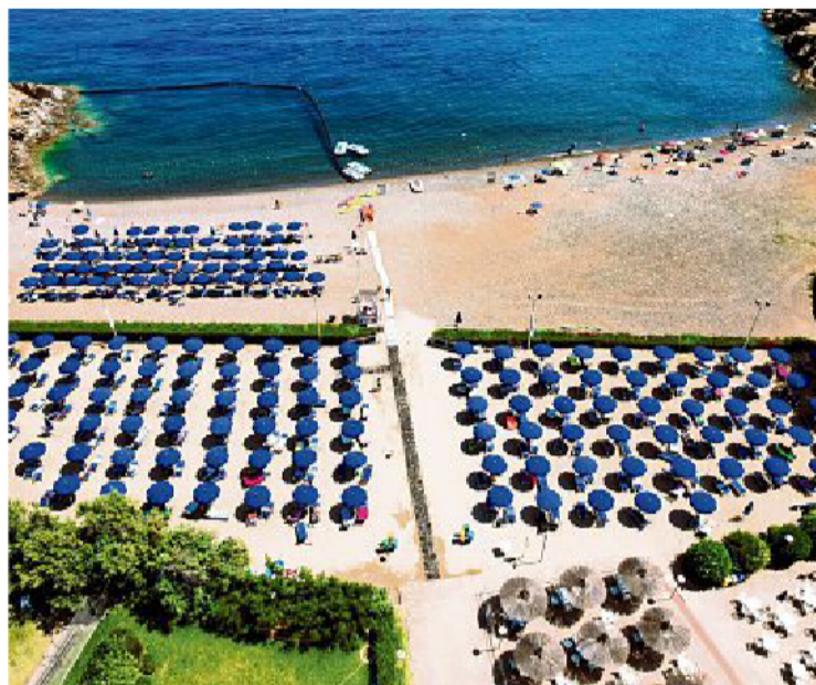
Sur l'île d'Elbe, le complexe Ortano Mare, désormais propriété de Reka, met à disposition de ses hôtes une plage privée, trois piscines et des infrastructures de loisirs variées.

Le complexe Ortano Mare dispose de 120 chambres d'hôtel et d'environ 120 appartements, pour quelque 800 lits au total. Un format hybride, plus hôtelier que les villages Reka habituels, qui mêle chambres d'hôtel et appartements pour les familles. Côté animation: trois piscines, des courts de tennis, football, beach-volley, sports nautiques, club pour les enfants, mais aussi concerts en soirée et