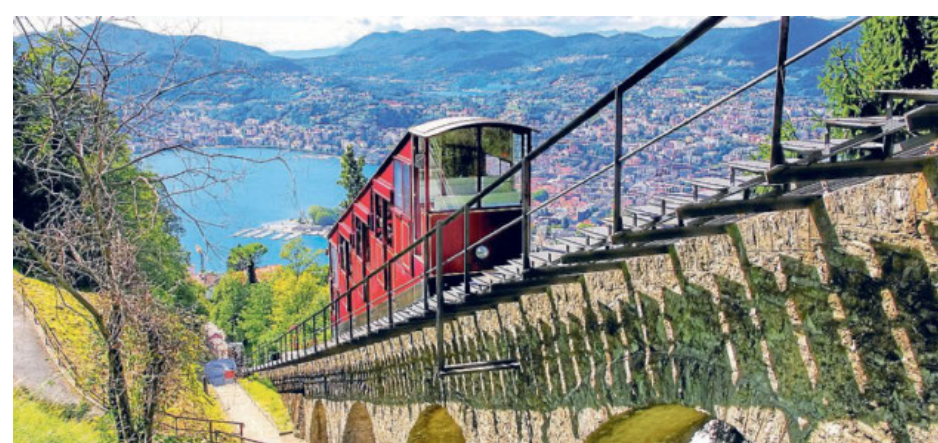
Lugano-Standseilbahn zum Monte Brè und Luganensersee.

■ Weitere Infos: www.myswitzerland.com , www.luganoregion.com